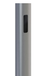
Окно ЗДФ для вывода кабеля